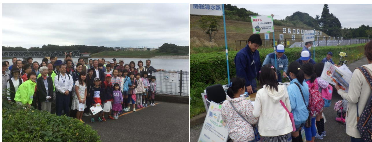
スタート前の記念写真