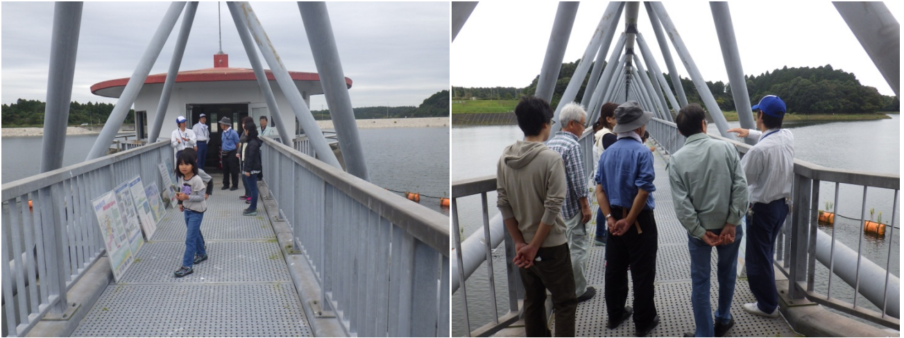
取水塔一般開放の様子