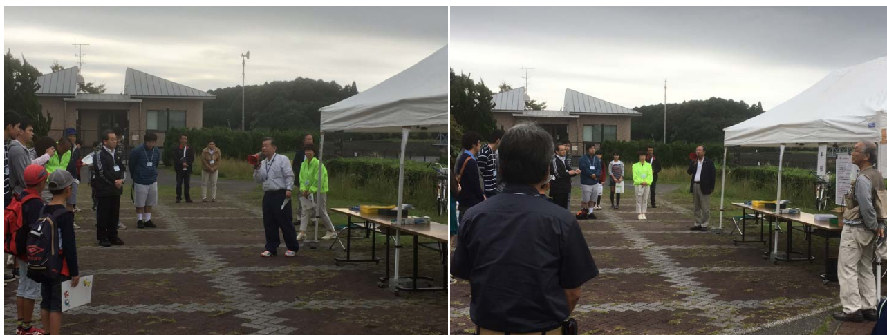
開会式における房総導水路所長（左）と東金市長（右）による挨拶

「環境ウォーク in ときがね湖」は、来年も開催が予定されています。興味を持たれた方は是非ご参加ください。